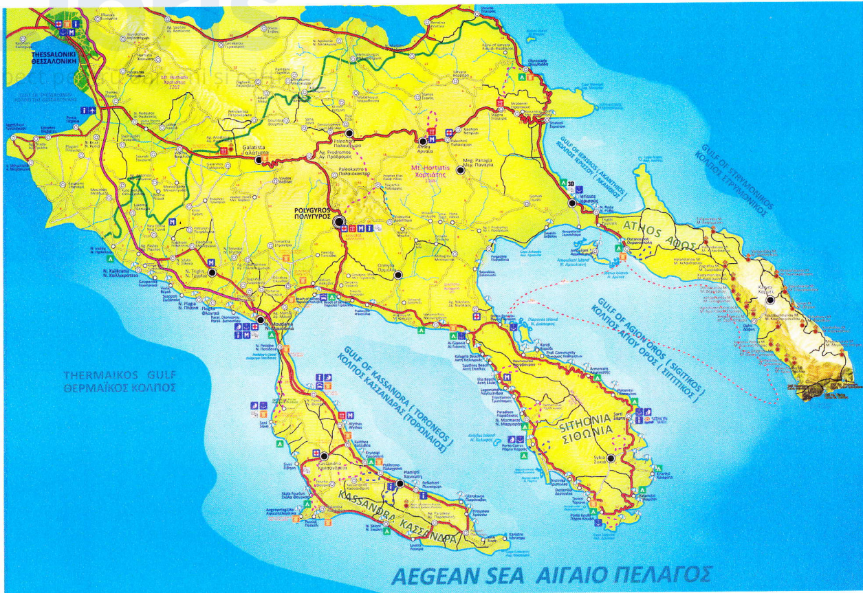
Peninsula Calcidică din Marea Egee.